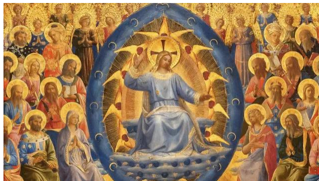
Fra Angelico: "Sąd Ostateczny" (fragment), Gemäldegalerie